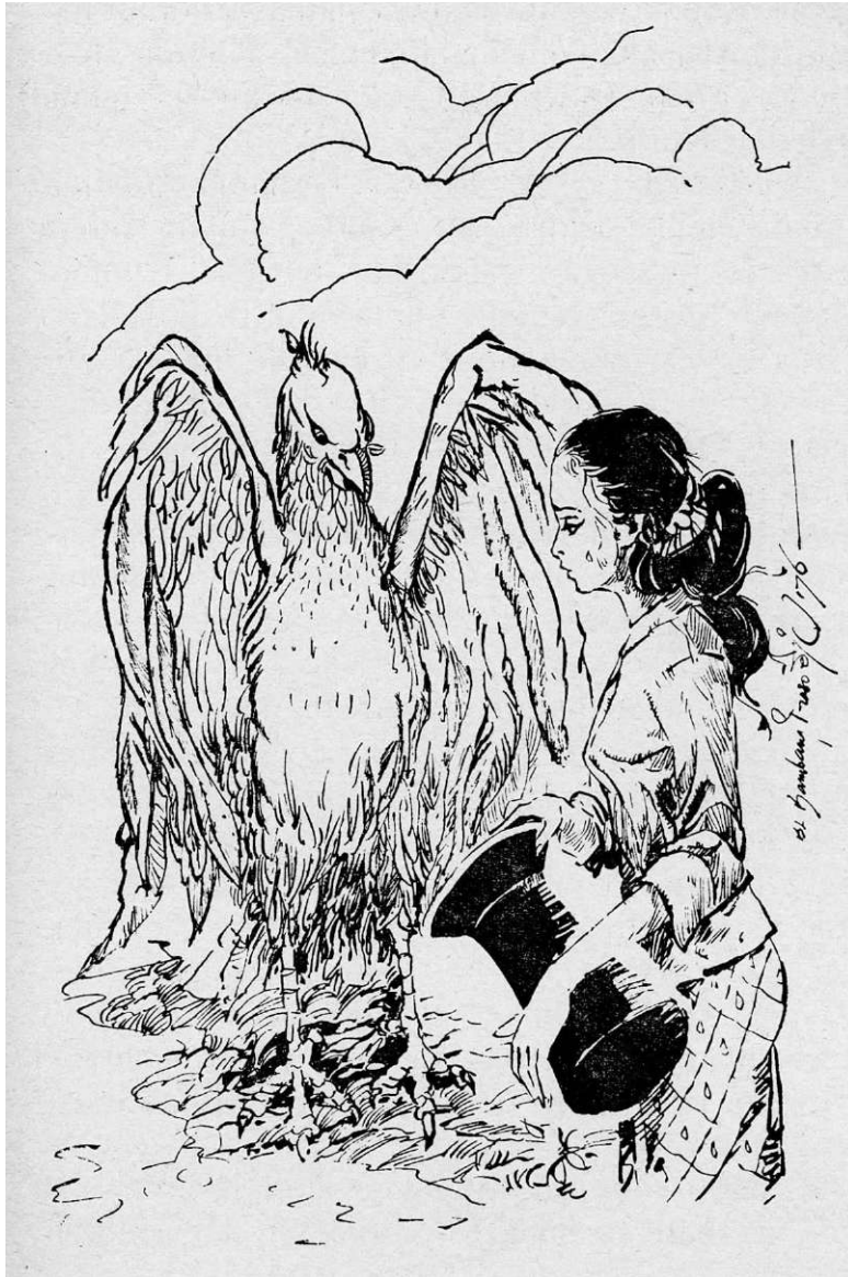
Kleting Kuning menceritakan apa yang telah terjadi.