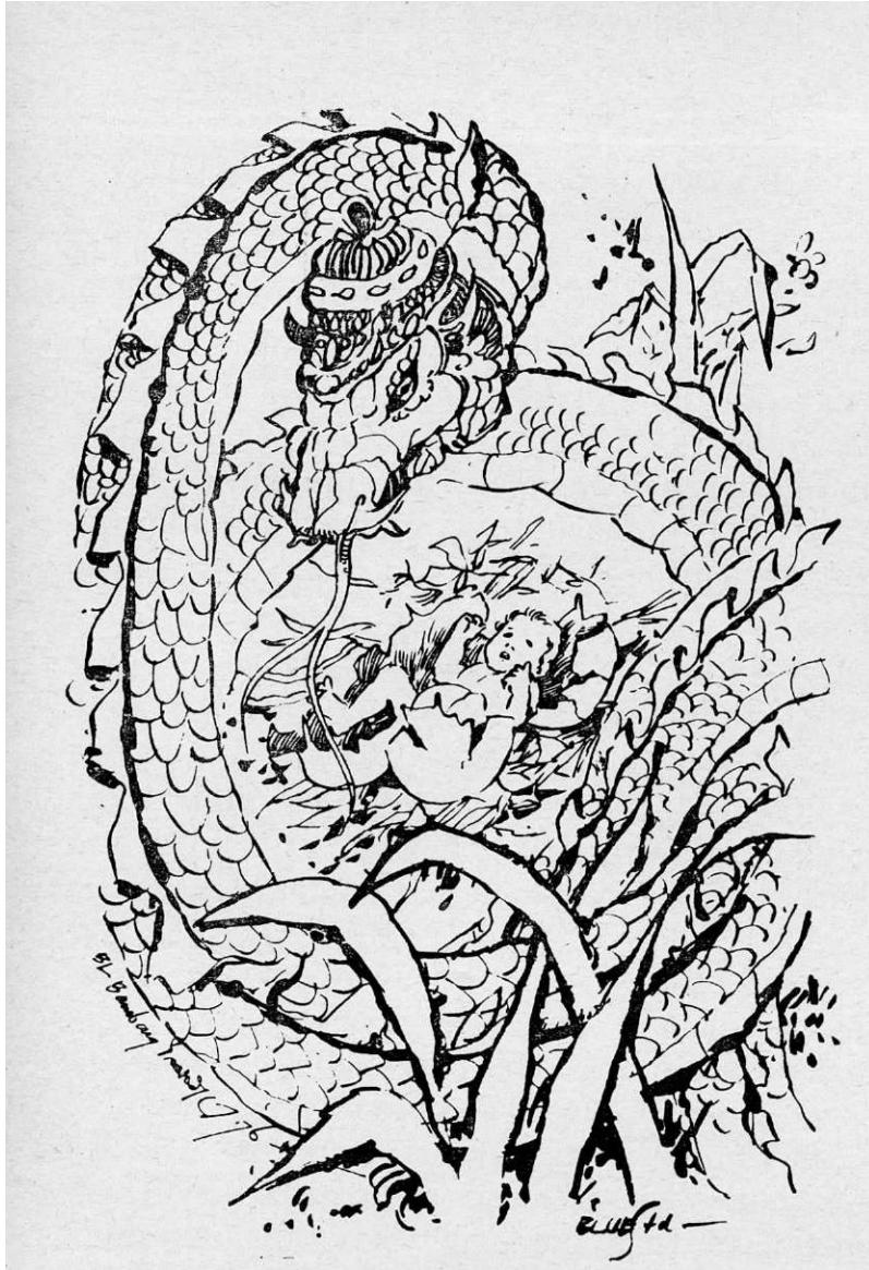
... , Menetaslah seorang putri cantik dari dalam telur itu.