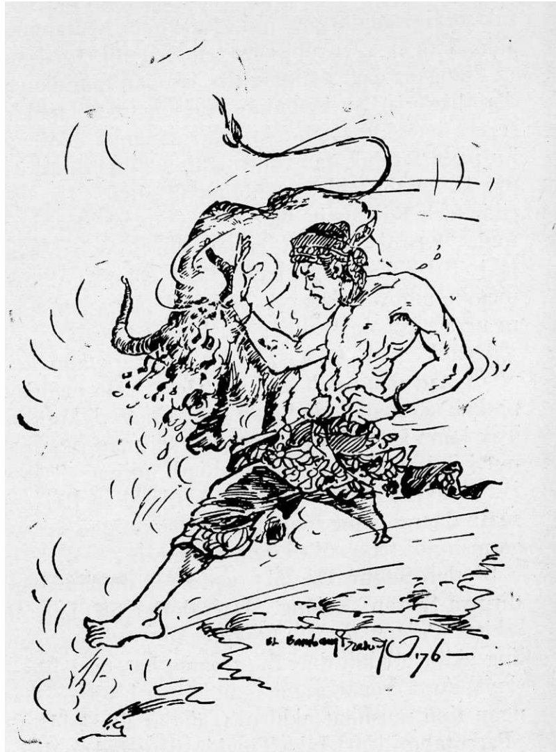
Dengan telapak tangannya ia menepuk kepala Banteng....