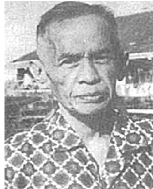
SM Kartosoewirjo Imam Awwal NII Sesungguhnya hidup dan matiku hanya untuk Allah semata

K.P.S.I. dipimpin langsoeng oleh Imam-Plm. T. APNII. Djika karena satoe dan lain hal ditoendjoek dan diangkatnjalah seorang Panglima Perang, selakoe penggantinja, dengan poerbawisesa penoeh.