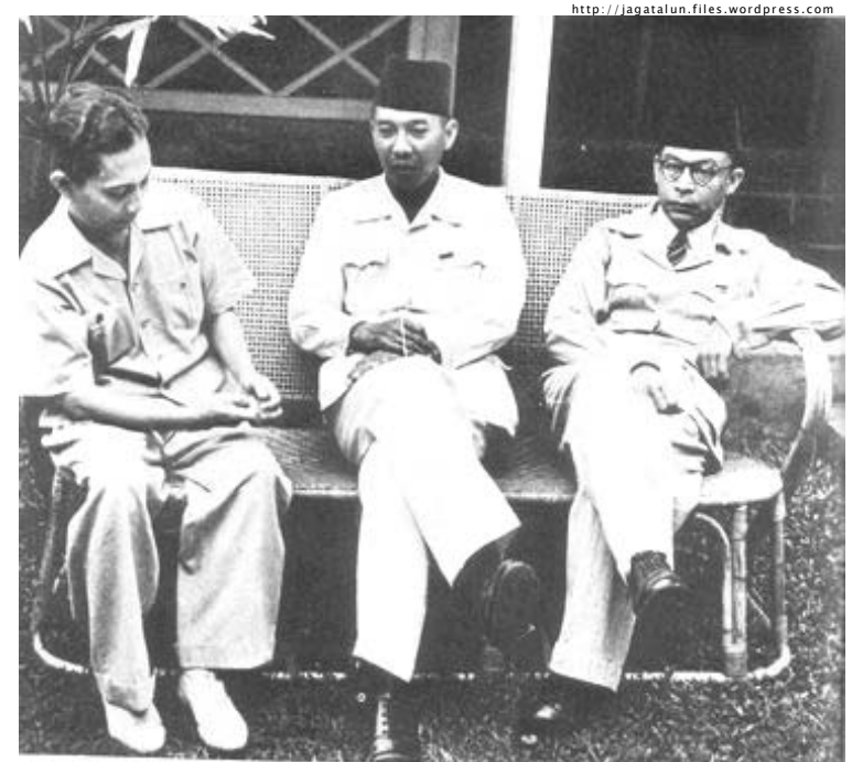
Tiga Serangkai Tokoh RI: Hatta, Soekarno, & Sjahrir Tidak begitu suka dengan Islam

sistem pemerintahan Republik Indonesia (dari presidentil menjadi parlementer) memungkinkan perundingan antara pihak RI dan Belanda. Dalam pandangan Inggris dan Belanda, Sutan Sjahrir dinilai sebagai seorang moderat, seorang intelek, dan seorang yang "telah pergi ke gunung-gunung" selama pemerintahan Jepang.