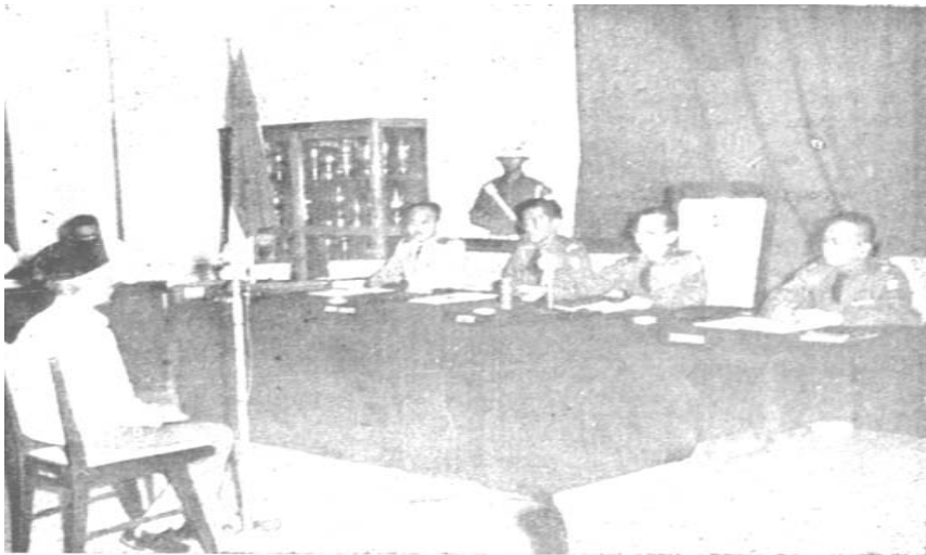
Imam NII SM Kartosoewirjo di hadapan Mahadper RI Sungguh setiap perjuangan memerlukan pengorbanan!

Hari ini perjuangan menegakkan Islam ditegakkan oleh muslimin, baik di Negara Kesatuan Republik Indonesia, maupun di Negara Islam Indonesia terus dilakukan. Apakah mereka akan bersinergi untuk tegaknya hukum Allah, atau apakah muslimin di NKRI tetap 'rela dibodohi' diperalat untuk menekan geliat para gerilyawan NII? Wallahu a'lam.