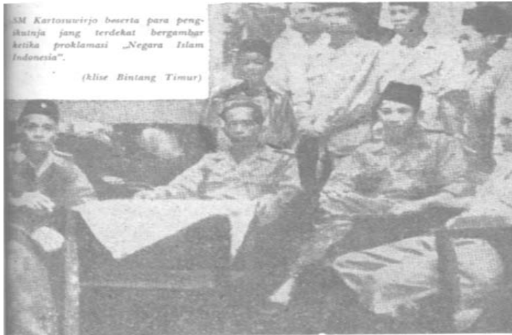
Imam Kartosoewirjo didampingi mujahid NII lainnya, selepas memproklamkan Negara Kurnia Allah – Negara Islam Indonesia

Sementara itu sejak tanggal 23 Agustus-2 November 1949 dalam Konferensi Meja Bundar di Den Haag dibahas masa depan Indonesia, salah satu hasilnya adalah perjanjian tentang “penyerahan” kedaulatan oleh Belanda kepada Republik Indonesia Serikat. 91 Di samping itu dari perjanjian-perjanjian tersebut banyak dikaitkan dengan persetujuan lain yang mengarah ke suatu ketergantungan langsung RIS kepada Belanda dan memungkinkan Belanda mengontrol politik dalam dan luar negeri RIS. Masalah berikutnya adalah peleburan anggota-anggota KNIL ke dalam APRIS dan pembentukan misi militer Belanda yang akan ditugaskan untuk melatih anggota-anggota APRIS. 92 Dan yang terpenting dari masalah itu adalah bagaimana upaya pemerintah RIS yang dipimpin oleh Soekarno menyelesaikan kasus Darul Islam sampai tuntas.