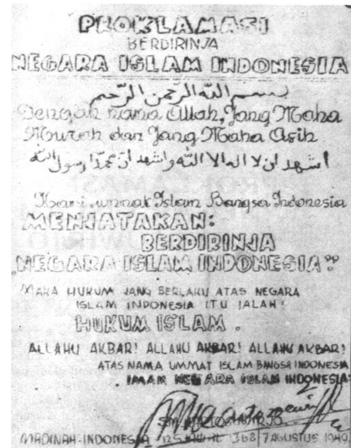
Teks Proklamasi Negara Islam Indonesia wujud penghambaan kepada Allah SWT.

Apabila Islam telah mewajibkan arag muslimin menjadi satu ummat yang mempunyai satu negara, maka "hukum wajib" ini menuntut supaya wilayah negara Islam meliputi semua negeri muslimin di seluruh dunia. Dasar pokok Islam adalah syari'at dunia, bukan lokal. Islam datang untuk seluruh dunia, bukan untuk setengah dunia. Untuk semua manusia bukan untuk sebagiannya. Islam adalah syari'at internasional, bukan hanya untuk satu kaum, bukan hanya untuk satu bangsa, bukan hanya untuk satu benua. Islam adalah syari'at alam semesta yang ditujukan kepada muslim dan bukan muslim. Tetapi tatkala kenyataan tidaklah semua manusia beriman dengannya, sehingga tidak mungkin memberlakukan hukum syari'at atas mereka, maka keadaan waktu hanya mengijinkan menjalankan syari'at Islam dalam negeri-negeri yang berada di bawah kekuasaan Ummat Islam. Demikianlah, bahwa pelaksanaan syari'at Islam bertautan rapat dengan kekuasaan dan kekuatan Ummat. Karena itu, apabila wilayah efektif yang dikuasai Ummat Islam menjadi luas, maka luas pulalah wilayah kekuasaan syari'at. Dan ketika wilayah kekuasaan Ummat Islam menjadi sempit, maka sempit pulalah kekuasaan syari'at. Peristiwa zaman dan keadaan daruratlah yang membuat syari'at Islam menjadi syari'at lokal, sekalipun pada mulanya dan dasar pokoknya adalah syari'at dunia. Dari keterangan di atas jelas kita bisa maklumi, mengapa terjadi perbedaan pendapat di kalangan para ahli ilmu.