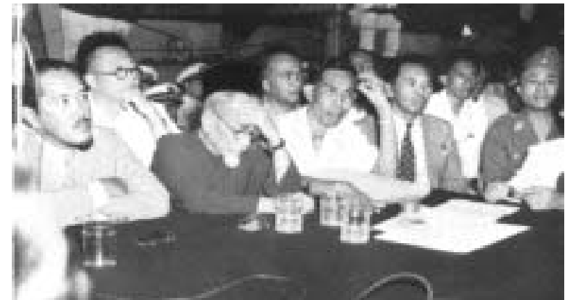
Delegasi Republik Indonesia pada Perjanjian Renville Perundingan RI – Belanda yang semakin mempersempit wilayah Republik. Lewat perjanjian ini nyata bahwa daerah Jawa Barat tidak lagi masuk ke dalam wilayah Republik Indonesia

Pada tanggal 19 Januari ditandatangani persetujuan Renville. Wilayah Republik selama masa peralihan sampai penyelesaian akhir dicapai, bahkan lebih terbatas lagi ketimbang persetujuan Linggarjati: hanya meliputi sebagian kecil Jawa Tengah (baca Jogja dan delapan Keresidenan) dan ujung barat pulau Jawa – Banten tetap daerah Republik. Plebisit akan diselenggarakan untuk menentukan masa depan wilayah yang baru diperoleh Belanda lewat aksi militer. Perdana menteri Belanda menjelaskan mengapa persetujuan itu ditandatangani: Belanda, katanya, tidak boleh “menimbulkan rasa benci Amerika”. 37