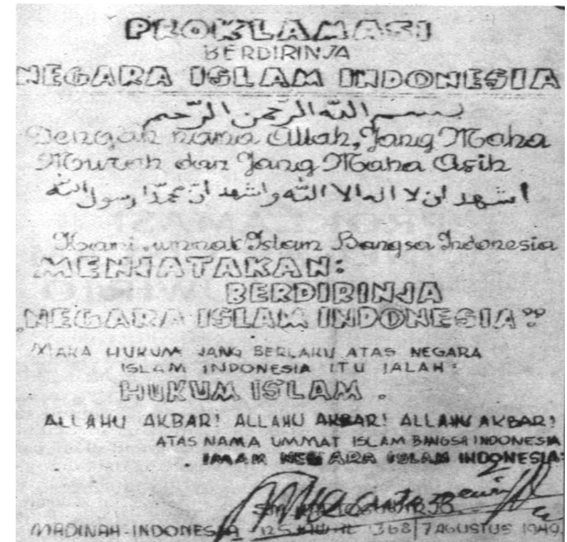
Proklamasi NII 7 Agustus 1949

Diperlukan sikap cerdas, istiqomah, rendah hati, memiliki hikmah mendalam dan pandangan luas dalam menyikapi perbedaan penafsiran di wilayah pendudukan ini. Tidak semua rakyat berjuang mengakui kepemimpinan Ali Mahfud adalah hal yang lumrah dalam keadaan negara berjuang seperti ini. Dalam negara berjaya pun ketidaksetujuan rakyat atas pemerintah bahkan bisa berlangsung sangat sengit dan keras. Menurut saya, keadaan ini merupakan ujian yang sangat menguntungkan bagi kematangan kedua belah pihak: pihak pemerintah diuji agar semakin matang dan arif melihat keadaan rakyat berjuang yang seperti ini, pihak rakyat pun tengah melakukan proses pembelajaran politik pemerintahan da-